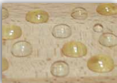
Vann- og olje-avstøtende effekt på absorberende tre

Overflateabsorpsjonen reduseres med nesten 90%, og den beskyttede overflaten beholder sin funksjon over tid, selv om "perle-effekten" forsvinner, spesielt på horisontale flater.