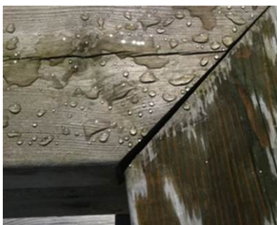
Vannavstøtende effekt på oppsprukne terrassebord mot ubehandlet terrassebord