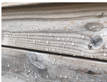
Vannavstøtende effekt på vertikale bord etter 5 år