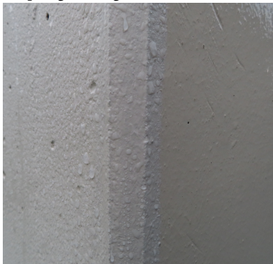
AquaDry sammenlignet med vanlig betongmaling